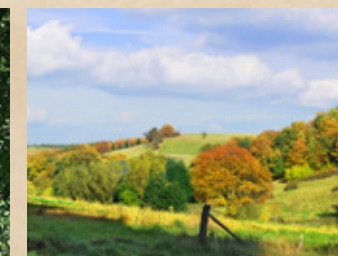
Das wunderschöne Tal des Bongarder Baches auf dem Weg zum Heyerberg