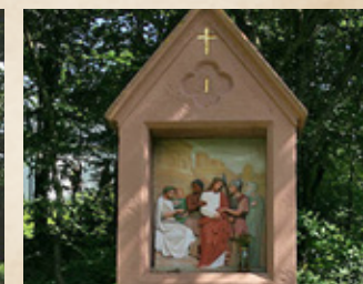
Eine der 14 Kreuzwegstationen auf dem Wallfahrtsweg zur Heyer Kapelle