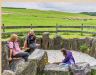
Der Bodenbacher Drees mit frischem Quellwasser ist ein guter Pausenplatz