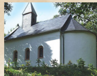
Wallfahrtskapelle „Heyer-Kapelle“ auf dem Heyerberg bei Borler